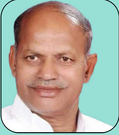
HON. SHRI. NARENDRA B DARADE