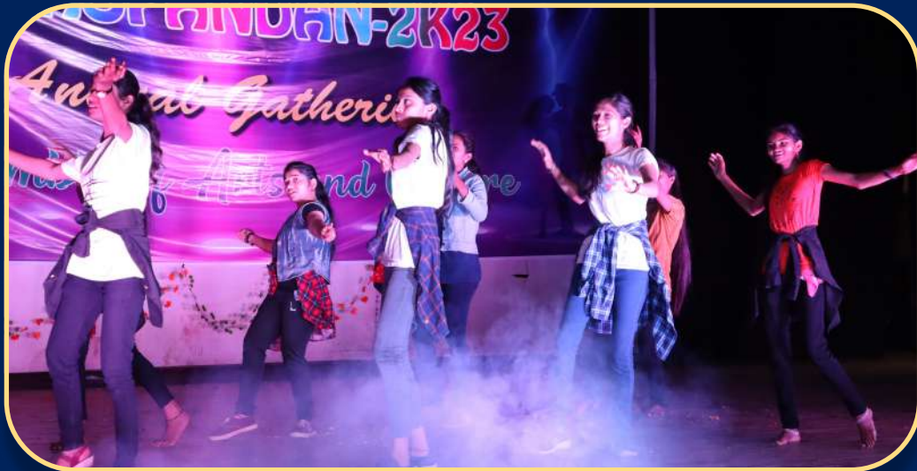
ANNUAL GATHERING FUNCTION YUVA SPANDAN ACTIVITY PERFORMED BY GIRLS