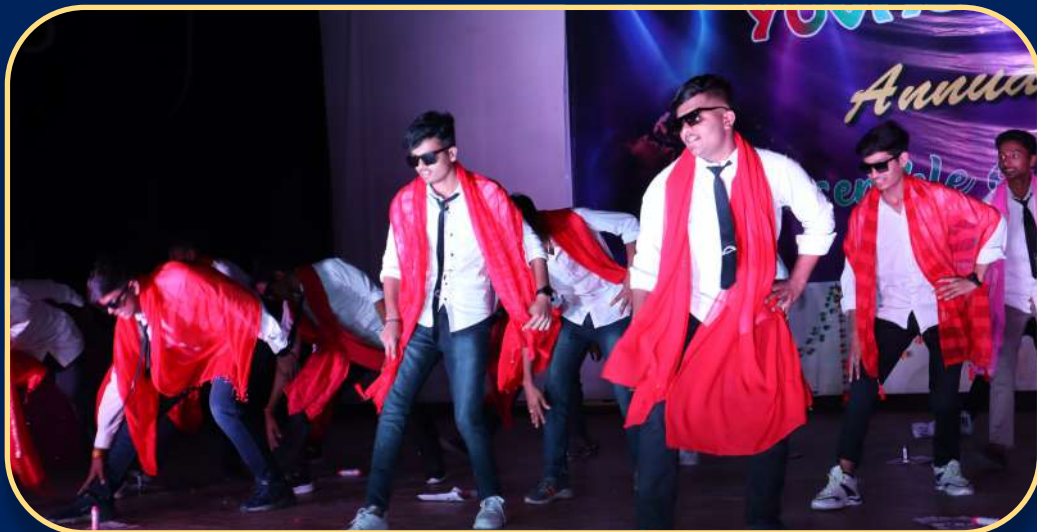
ANNUAL GATHERING FUNCTION YUVA SPANDAN ACTIVITY PERFORMED BY BOYS

"WHEN YOU EDUCATE ONE PERSON YOU CAN CHANGE A LIFE, WHEN YOU EDUCATE MANY YOU CAN CHANGE THE WORLD"