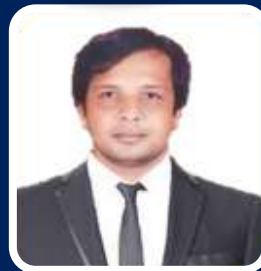
HON. RUPESH L DARADE